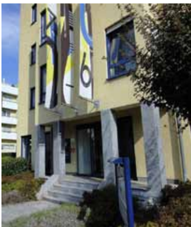
Firmensitz in Oberursel/Taunus

Wir möchten, dass sich unsere Mandanten schon beim Betreten unserer Geschäftsräume wohlfühlen. Darauf haben wir bei der Gestaltung und Einrichtung besonderen Wert gelegt. Unsere mit modernster Technik ausgestatteten Büros und Besprechungsräume bieten ideale Voraussetzungen für Beratung und Betreuung in angenehmem Ambiente. Daneben schätzen unsere Mandanten die gute Erreichbarkeit und diskrete Atmosphäre unserer Büros – eben Beratung mit Wohlfühlfaktor.